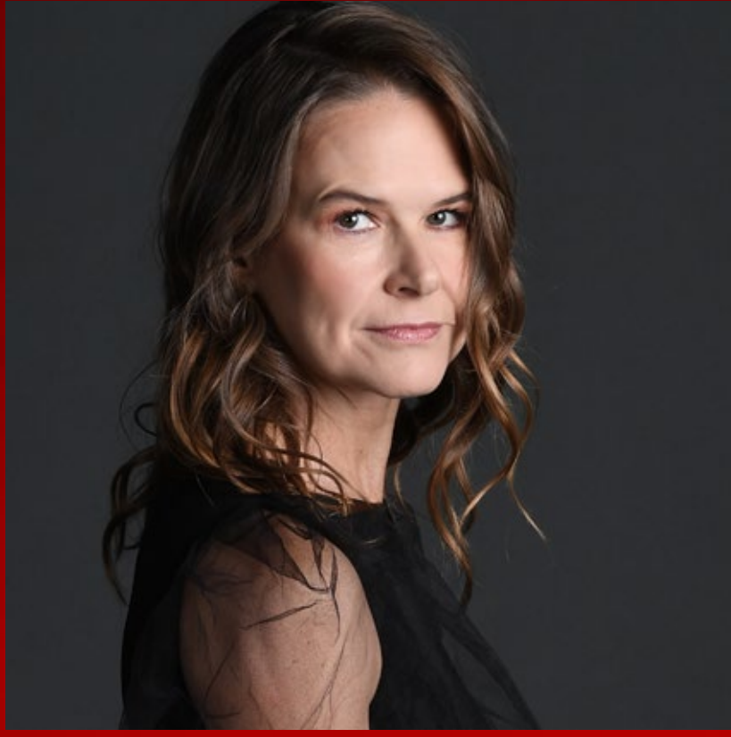
NAILEA NORVIND Eva